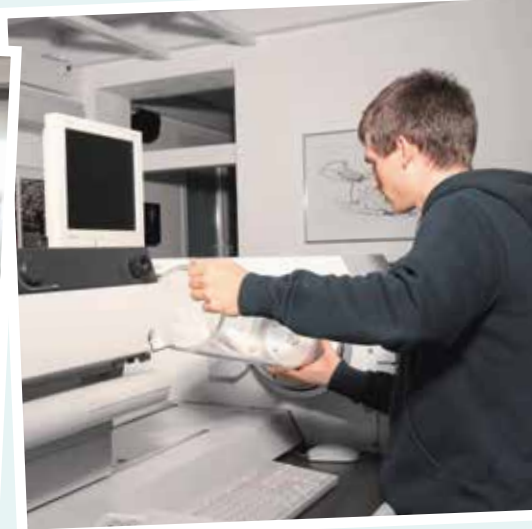
Bedienen einer Druckmaschine