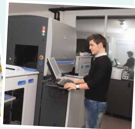
Aufbereitung der Daten am PC