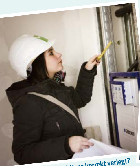
Sind alle Anschlüsse korrekt verlegt?