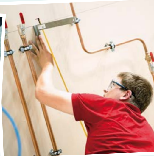
Verlegung der Heizungsrohre