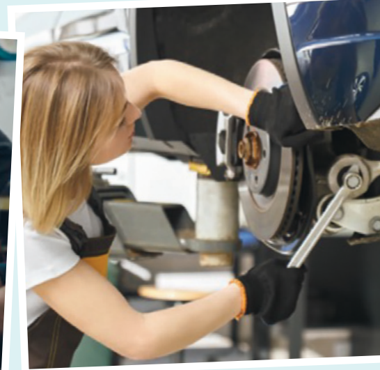
Reparatur des Fahrwerks