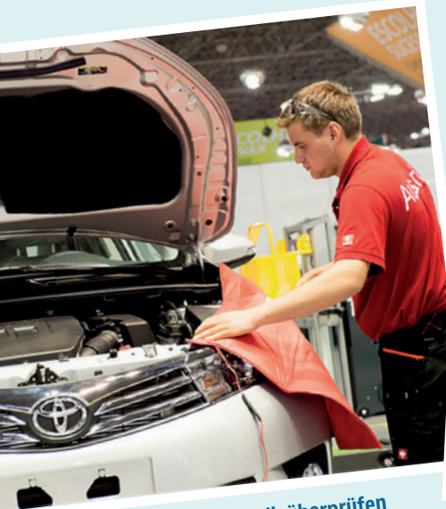
Funktion der Elektronik überprüfen